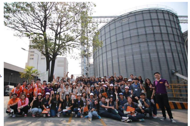
นักศึกษาสาขาวิชาเทคโนโลยีอาหาร เทคโนโลยีการผลิตพืช เทคโนโลยีการผลิตสัตว์ และวิศวกรรมเกษตรและอาหาร ที่เข้าร่วมกิจกรรม “Industry-based Career Camp 2016” ระหว่างวันที่ 26-27 มีนาคม 2559

“การที่พวกเราสาขาเทคโนโลยีอาหารได้เข้าร่วมกิจกรรมที่ศูนย์สหกิจศึกษาและพัฒนาอาชีพ ร่วมกับเครือข่ายโคร จัดกิจกรรมให้เราได้เห็นภาพสายการผลิตที่เป็นของจริง เข้าใจและมองเห็นภาพการทำงานได้มากกว่าการดูรูปแผนผังในกระดาษ เห็นถึงการทำงานหน้างานจริงๆ และเข้าใจหน้าที่ของแต่ละตำแหน่งงานว่าทำอะไรบ้าง อีกทั้งยังได้ไปพักผ่อนรีสอร์ตที่บรรยากาศดี อาหารอร่อย กิจกรรมสันทนาการที่สนุกสนานและยังสอดแทรกข้อคิดต่างๆ ที่ช่วยให้เราสามารถปรับตัวให้เข้ากับเพื่อนร่วมงานที่มีลักษณะนิสัยที่ต่างกัน รวมทั้งได้ฟังการบรรยายการใช้ชีวิตในโรงงาน การปรับตัวเข้าอยู่กับคนหมู่มาก และร่วมกิจกรรมในศูนย์เรียนรู้วิถีชีวิตพอเพียง”